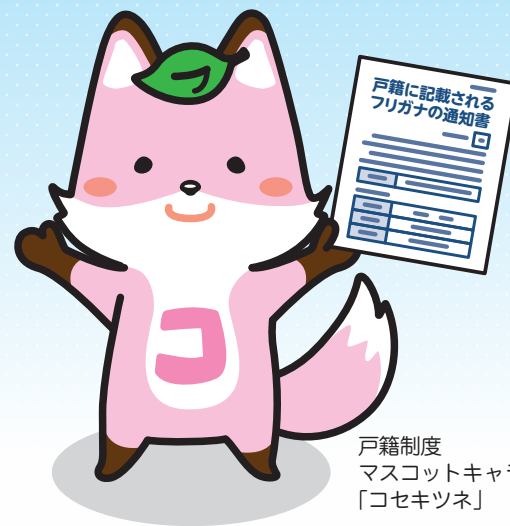
戸籍制度 マスコットキャラクター 「コセキツネ」